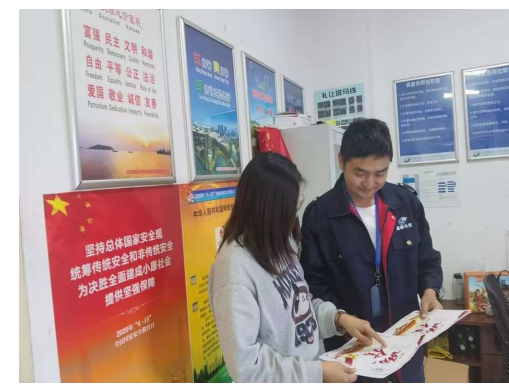
育活动,进一步提升全... 设,尤其是在为民服务